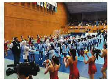
③ハイタッチキッズイメージ

各試合の選手入場時に、選手とハイタッチし試合 に花を添えるお子様を社員のご家族等から募集 していただくことが可能です。 ※手をつないでの入場ではなくハイタッチのため、 人数が少なくても対応可能です。