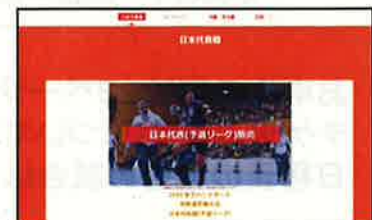
⑤チケットホームページ