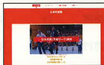
⑤チケットホームページ