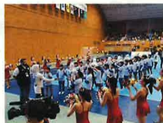
③ハイタッチキッズイメージ

各試合の選手入場時に、選手とハイタッチし試合 に花を添えるお子様を社員のご家族等から募集 していただくことが可能です。 ※手をつないでの入場ではなくハイタッチのため、 人数が少なくても対応可能です。